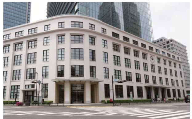
【東京中央郵便局 所在地】 〒100-8994 東京都千代田区丸の内二丁目7番2号