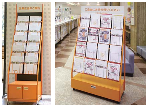
[左]10枠、[右]16枠 その他5枠、1枠タイプの専用パンフレットラックもございます。

対象局：全国約20,000局 掲出期間：1期2週間(月曜開始) 申込枠数：1局1枠～ 連続掲出：12週間 ※掲出期間は2週間ですが、非営業日は掲出されないことがあります。