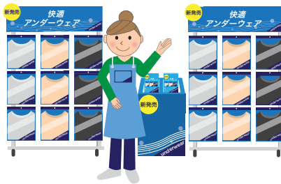
商品販売イベント